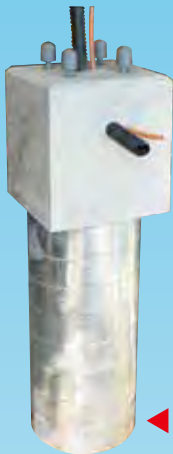
▲ 道路用照明柱 スパイラルダクト基礎