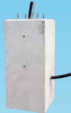
▲ アンカー・パイプ埋込タイプ (ベースプレート式の場合)