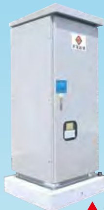
▲ キュービクル基礎