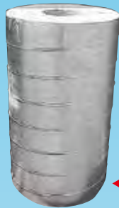
▲ 道路用 照明ポール基礎