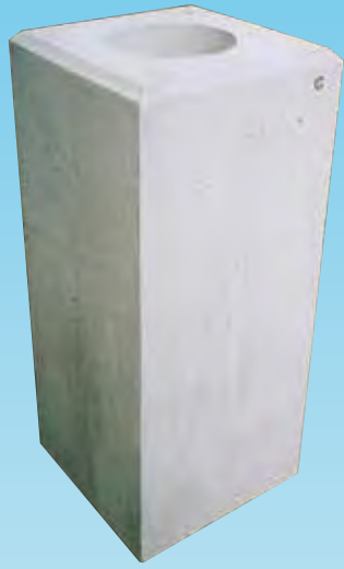
▲ 貫通穴タイプ (埋込み式の場合)